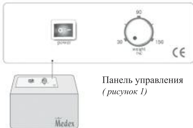
Панель управления (рисунки 1)