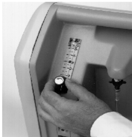
Рис. к пункту 7.