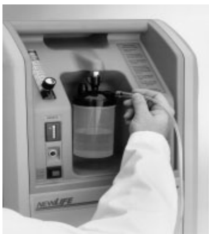
Рис. к пункту 4.