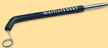
Monopolare Elektrode nach Palti (80-461-23-04) zum effektiven Freilegen des Implantationskanals